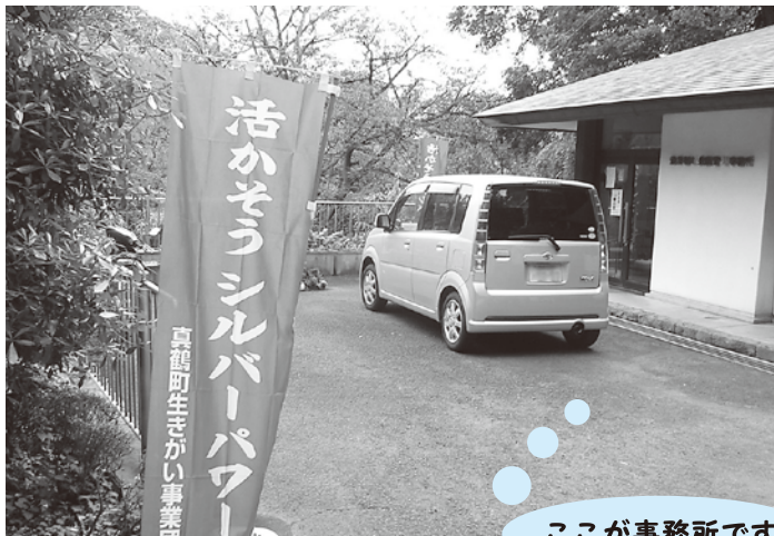
ここが事務所です

荒井城址公園内管理事務所 (電話0465-68153 54 8時30分~17時)