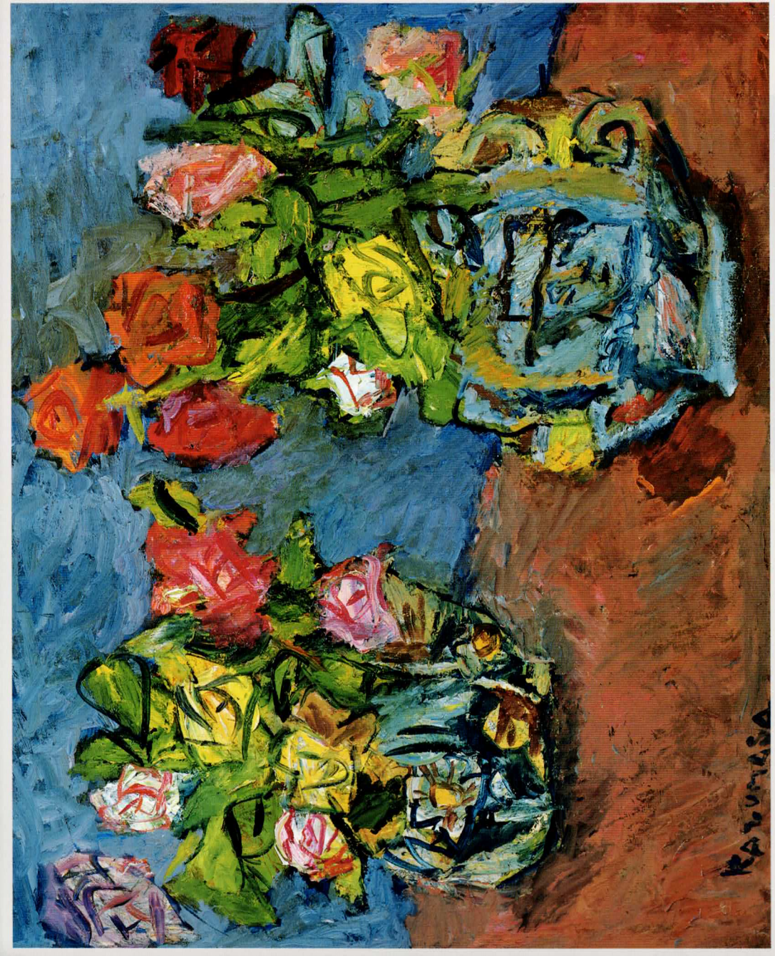
二つの壺の薔薇 F 30 1986年

開館時間 午前10時～午後4時 (入館は午後3時30分まで) 休館日 年度ごとの当館カレンダーに準ずる。 (詳細は、お問い合わせください。) 観覧料 大人 600円 一般 500円 団体20名以上 350円 (常設の場合) 高校生以下 250円 団体20名以上 交通 東海道線真鶴駅よりバス15分 (中川一政美術館下車) 開館日 平成元年3月2日 管理運営 真鶴町教育委員会