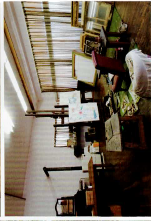
上 展示室3 下 アトリエ復元