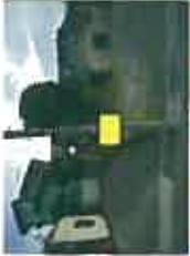
3 (旧)カ石歯科医院前