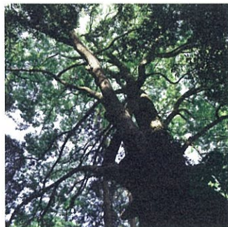
海や「お林」などの自然の恵み