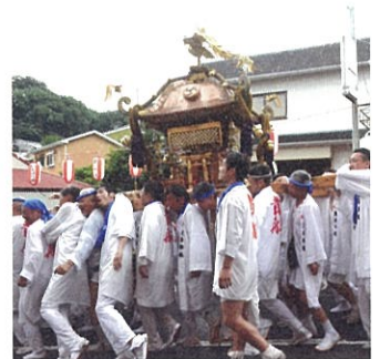
人と地域がつながる催し

* 美の基準 1994年に施行された真鶴町のまちづくり条例。真鶴の景観の美しさを69のキーワードでまとめたもの。