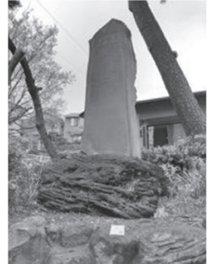
真鶴消防団 第1分団付近