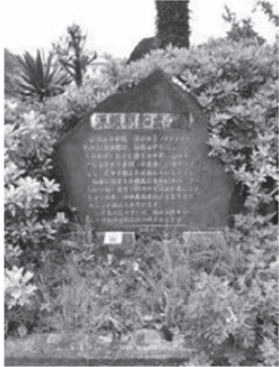
岩漁港入口 (町道1号線側)