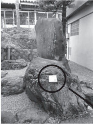
真鶴駅構内 (待合所付近)