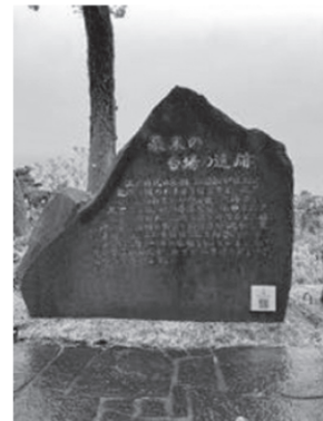
ケープ真鶴裏庭 三ツ石海岸下り口付近