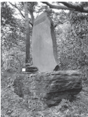
お林遊歩道入り口