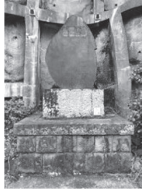
岩漁業協同組合先 道路右側