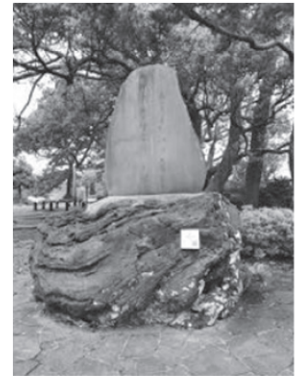
ケープ真鶴裏庭 三ツ石海岸下り口付近