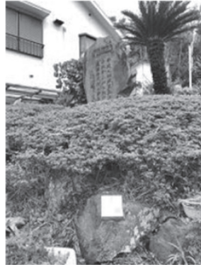
岩漁港入口 (岩漁港側)