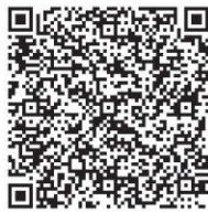
電子申請はこちらから