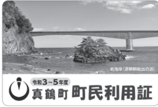
↑新しい町民利用証