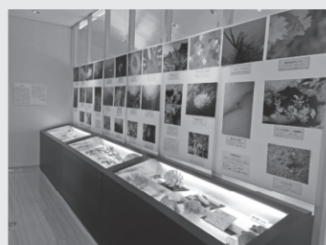
4回目となる写真展

※緊急事態宣言の状況により開館時間を変更する可能性があります。お越しの際はホームページなどで確認ください。