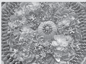
作品中央部のアップ

「セーラーズバレンタイン展」、もうご覧いただけましたか？今回はあらためて展示を紹介いたします。と言うのも、先日、来館者から「実物は写真で見たよりすごかった」という声をいただいたからです。これはまさしくそのとおりで、実は、今回の特別展ポスターでは、作品の存在感を表現できないのが悩みでした。ポスターに掲載した作品は、なんと直径1mもあります。そこに貝殻が隙間なく並べられていくというだけでなく、倒れるのですが、それぞれの貝殻は平面ではなく立体的に配置され、特に作品の中央部はまるで花束のようです。本作品には国内で見られる貝ばかり30種以上が用いられて、日本の海が表現されています。さらにフ