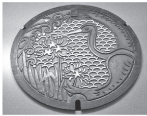
↑ このマンホールが下水管の目印です