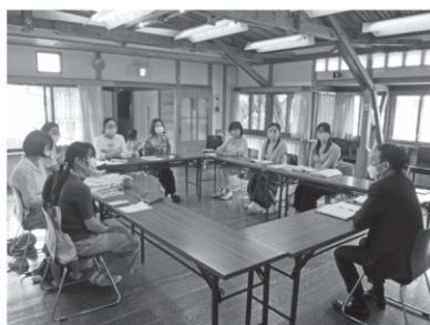
前回の移動町長室の様子

5名～10名程度の参加者を集めていただき、政策推進課へお電話ください。参加人数や希望時間をお伺いします。