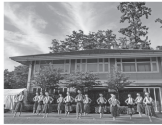
過去のマナ真鶴の様子

自然豊かな真鶴を舞台に、神に捧げる伝統のフラダンスを披露します。精霊と自然のエネルギーを心と体で感じてみませんか？