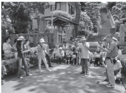
← 過去の成人学級の様子 (貴船神社にて)