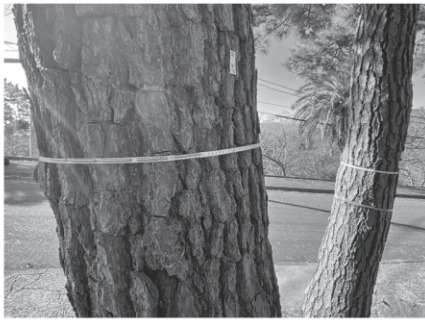
→デンドロメーターを設置したマツ

今年度は設定した範囲内のマツに対し調査を行い、今後もお林保全の方向性を裏付けるための重要な調査として実施していくため、より正確で効率的に実施できる「デンドロメーター」を設置しました。マツの幹にスチールメジャーやバネを付けています。