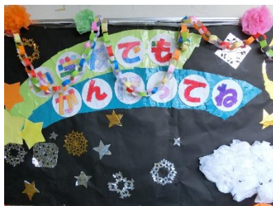
👉1年生の飾り（上）とお手紙の入ったポケット（右） 👉※6年生とのペア写真つき