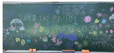
👉3年生は、6年生の教室の黒板にメッセージを書きました。壁にも飾りを作って階段に貼っています。